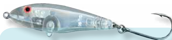
a Z90 da Deconto, faz o mesmo trabalho das "João Pepino", mas por ser menor favorece as fisgadas e pode ser usada na maioria das situações

Uma mudança muito comum é a substituição